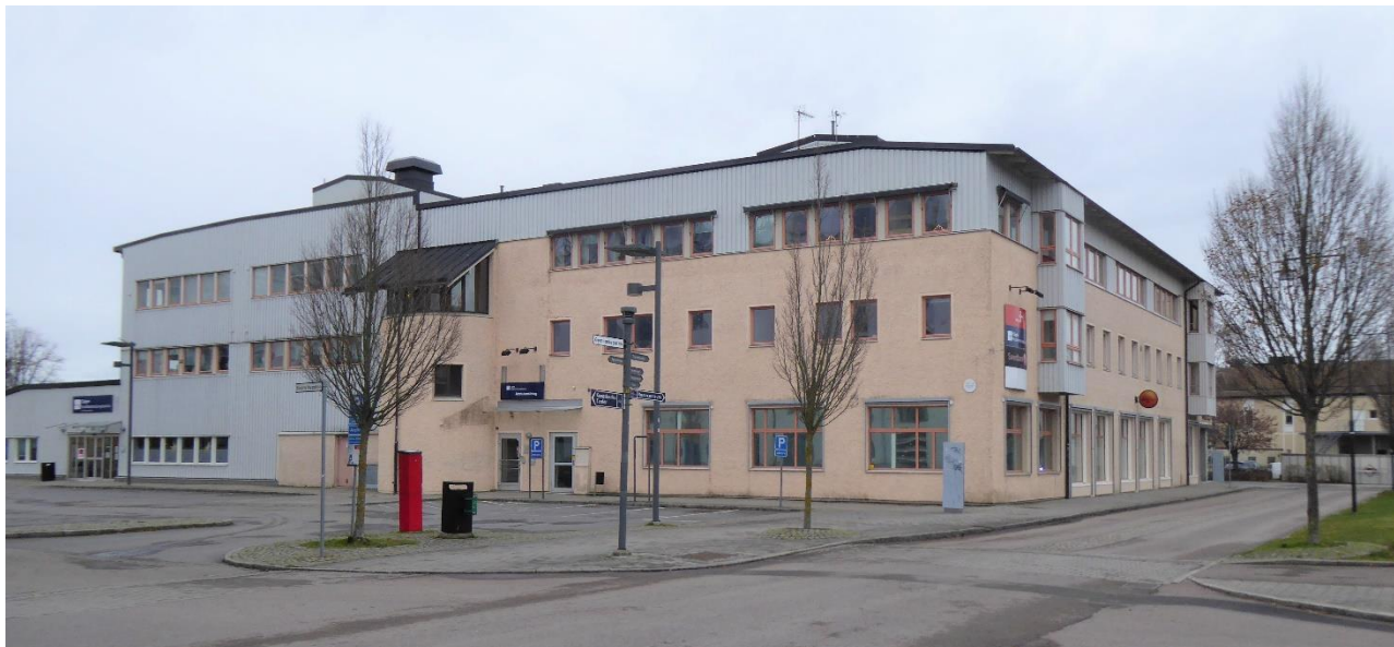
Swedbankhuset, Nygatan 10 C.

I samtliga språkcirklar försöker vi kombinera inläringens fyra element; högläsning/uttal, grammatik, textförståelse och kommunikation/dialog.