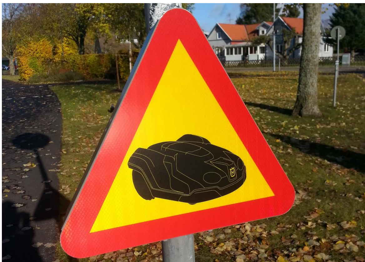
Varning för robotgräsklippare.